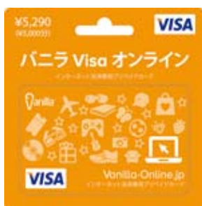
バニラ Visa オンライン 5290