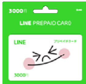
LINE プリペイドカード 3000