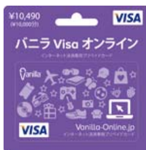
バニラ Visa オンライン 10490