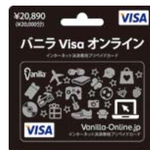
バニラ Visa オンライン 20890

コネクシオは、今後も新たなサービスの拡充を図り、コンビニチェーンをはじめとした小売事業者向けの様々なサービスを展開して参ります。