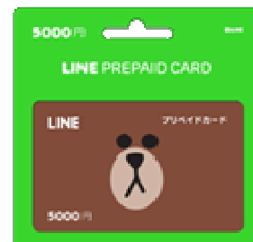
LINE プリペイドカード 5000