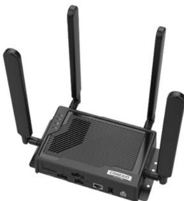
図1 CONEXIOBlackBear 5G モデル

コネクシオは、本製品をコネクシオが提供する 5G ソリューションの中核と位置づけ、スマートファクトリーやスマートコンストラクション分野を中心に、AI/AR などさまざまな最先端技術と連携した IoT ソリューションを提供してまいります。また、5G 基地局ベンダーやシステムインテグレータと協業し、ローカル 5G 基地局の販売・構築のほか、免許取得申請支援から運用支援までのトータルソリューションを提供してまいります。